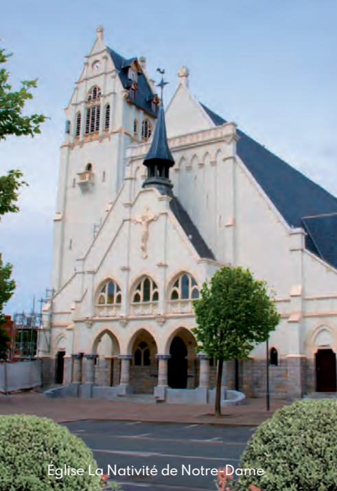
Eglise La Nativité de Notre-Dame