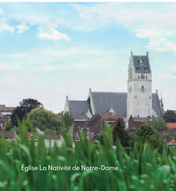
Eglise La Nativité de Notre-Dame